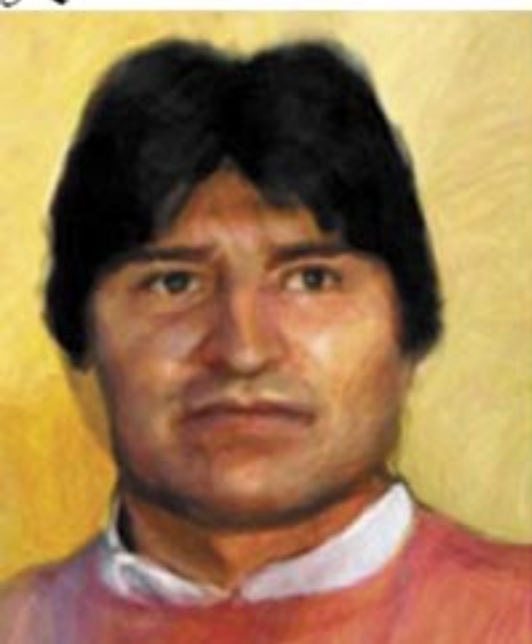
Data Nešina poklon sličica: "Evo Morales"